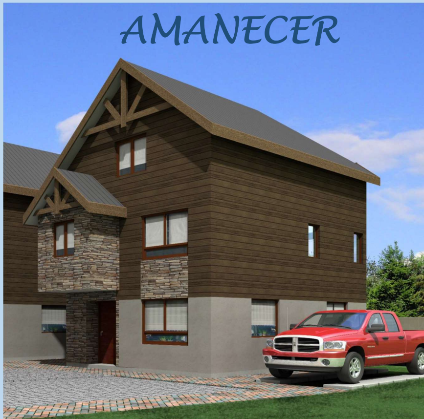
CASA TIPO 2