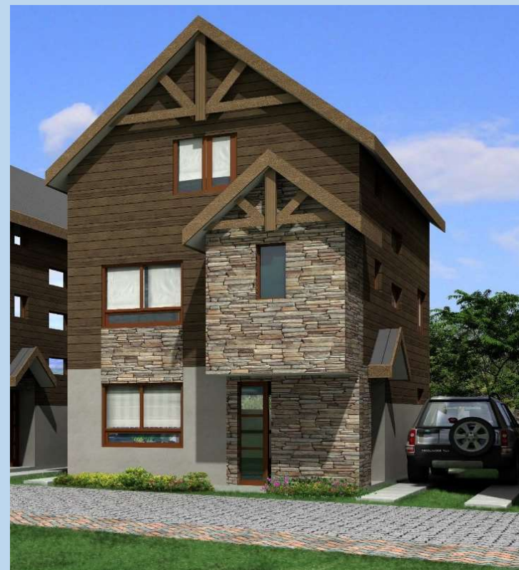
CASA TIPO 1

Condominio con dos modelos de casas, excelente distribución brindando tranquilidad y gran comodidad a tu familia. Cuenta con un gran diseño pensado para que aproveches cada espacio, condominio rodeado de servicios y construcción de gran calidad.